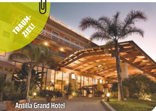
Antilla Grand Hotel